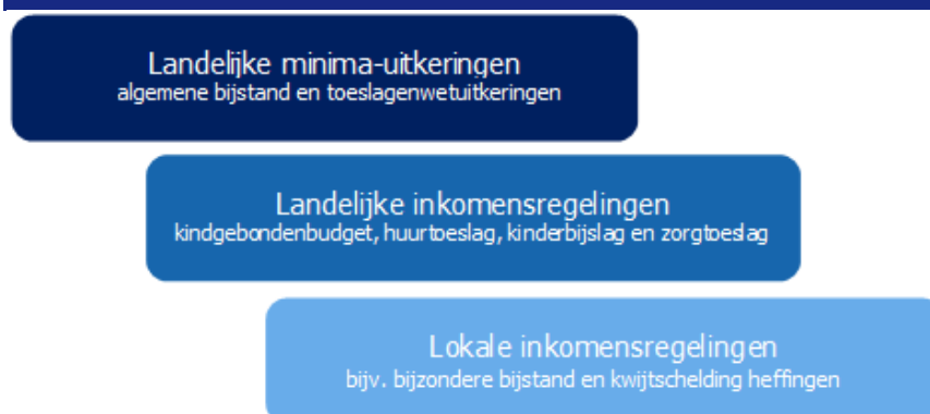
figuur 2-3: componenten stelsel inkomensondersteuning

Landelijke minima-uitkeringen zijn uitkeringen bedoeld om mensen met geen of weinig inkomen te voorzien in noodzakelijke bestaanskosten. Voorbeelden van landelijke minima-uitkeringen zijn de bijstandsuitkering en toeslagenwetuiterkeringen (zoals de WW- en de Ziektewetuiterkering). De bijstandsuitkering is de basisregeling